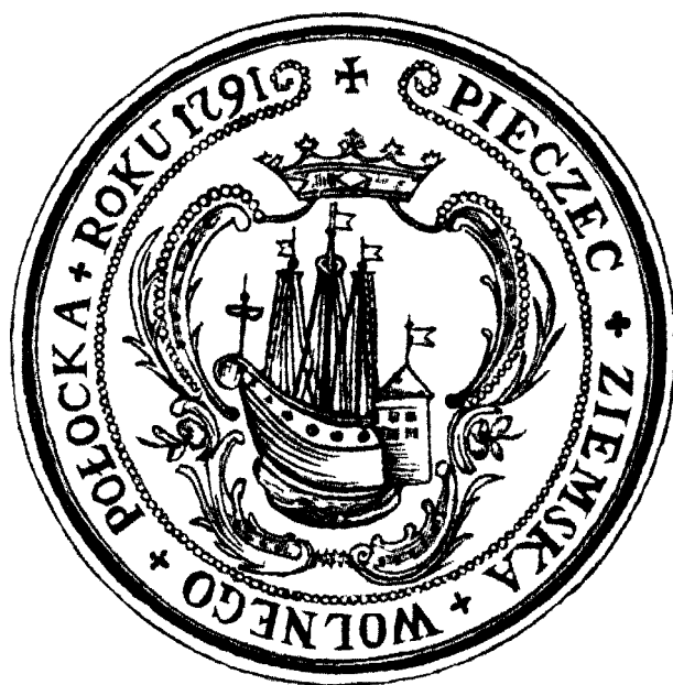
Мал. 8. Полацкая пячатка 1791 году.