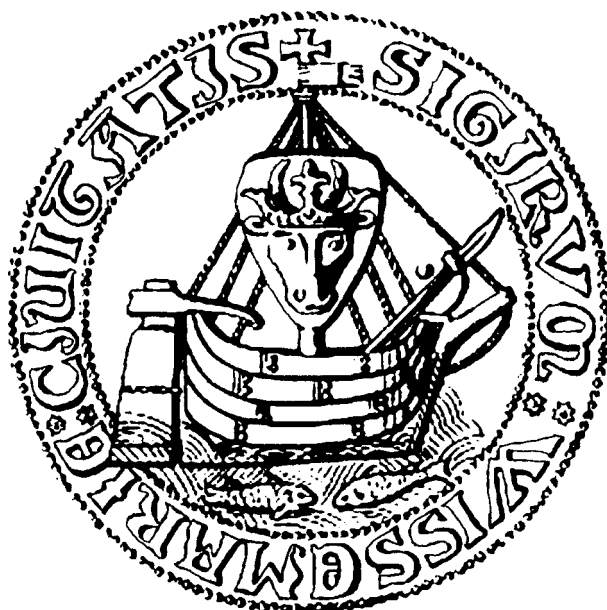
Мал. 3. Пячатка Вісмара.