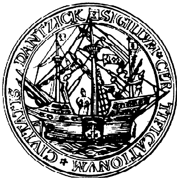
Мал. 5. Гданьская гандлёвая пячатка XVI ст.