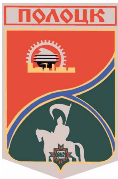
Мал. 10. Полацкі герб 1968 году.