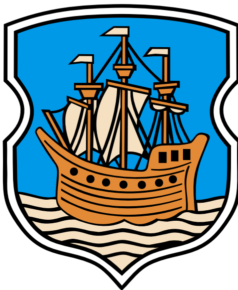
Мал. 12. Полацкі герб 1992 году.