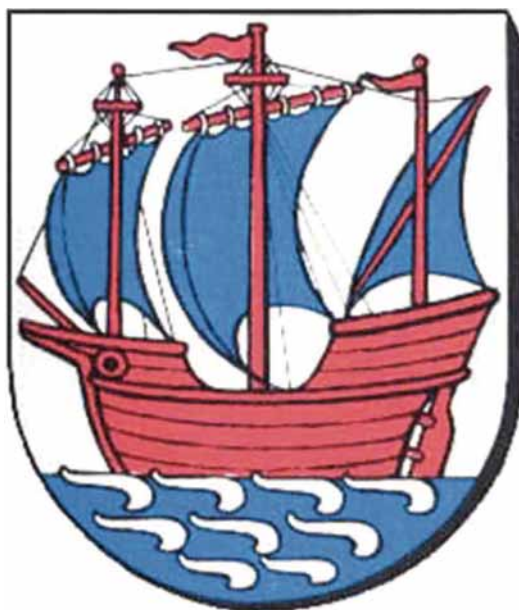
Мал. 14. Сучасны герб Кэртэміндэ.