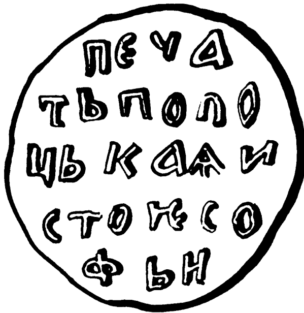
Мал. 1. Пячаткі полацкіх дамоваў канца XIV — пачатку XV стст.