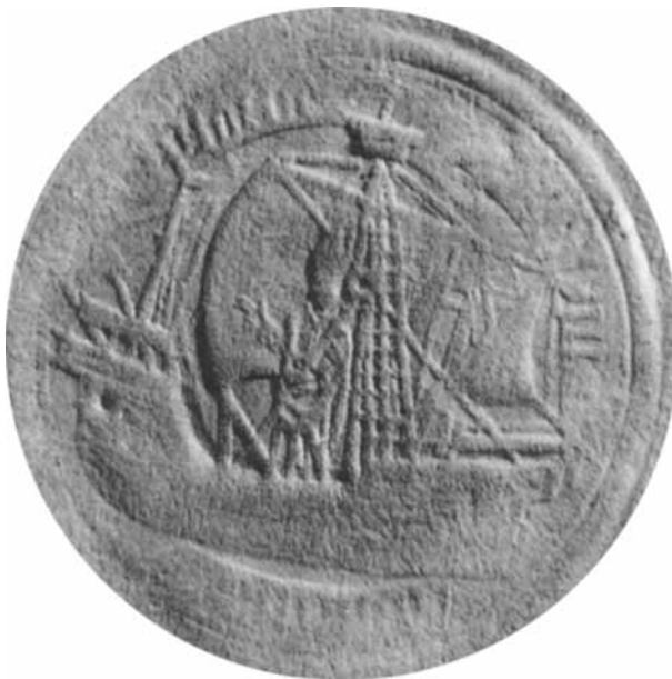
Мал. 2. Полацкая пячатка пачатку XVI ст.