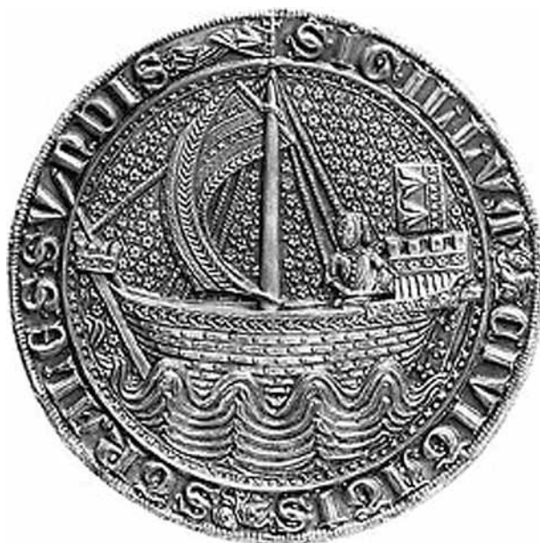
Мал. 6. Пячатка Стральзунда XIV ст.