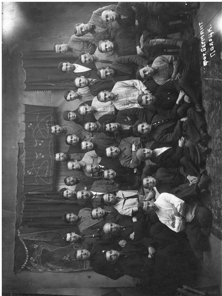
Фотаздымак. Калектыў рэдакцыі і друкарні газеты «Полоцкий пахарь». 1925 г.