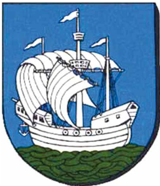
Мал. 13. Сучасны герб Багэнзэ.