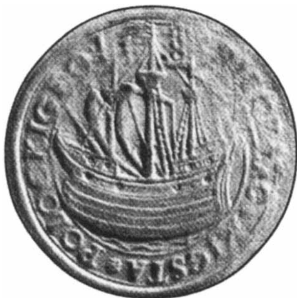
Мал. 7. Полацкая пячатка 1587 году.