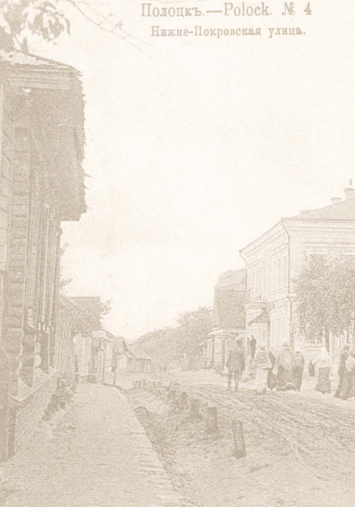
Полоцкъ.—Ролоск. № 4 Нижне-Покровская улица.