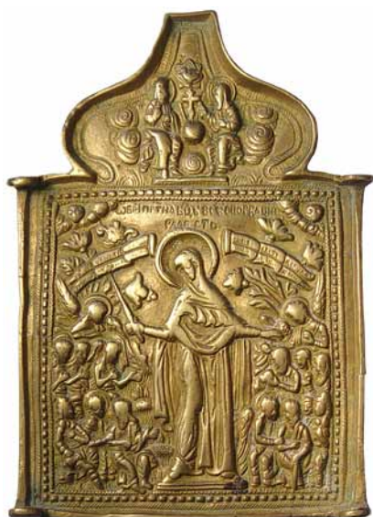
46. Срэднік абраза складанага трохстворкавага «Маці Божая Усіх смуткуючых радасць». XVIII ст.