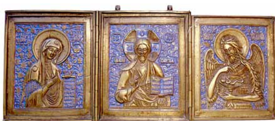
48. Абраз складаны трохстворкавы «Дзісус». XIX ст.