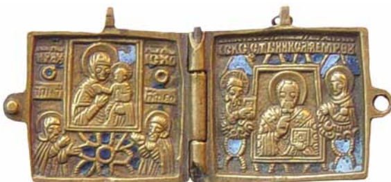
45. Абраз складаны двухстворкавы «Маці Божая Адзігітрыя з прадстаячымі прападобнымі Антоніем і Феадосіем. Свяціцель Мікола Цудатворца з Ісусам Хрыстом і Маці Божай». XIX ст.