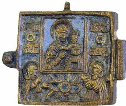
43. Частка абраза складанага двухстворкавага «Маці Божая Адзігітрыя з прадстаячымі прападобнымі Антоніем і Феадосіем». XVII ст.