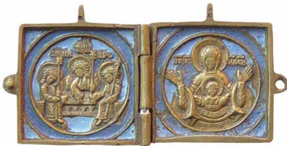
44. Абраз складаны двухстворкавы «Тройца Старазапаветная. Маці Божая Знаменне». Кан. XVIII – пач. XIX стст.