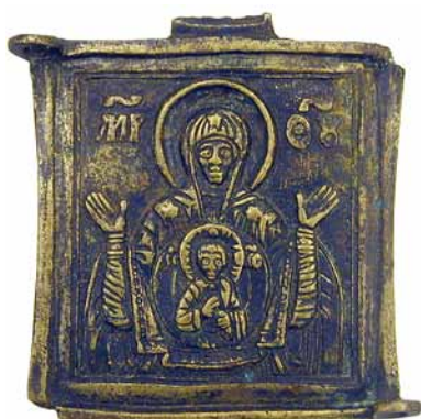
47. Срэднік абраза складанага трохстворкавага «Маці Божая Знаменне». XVIII ст.